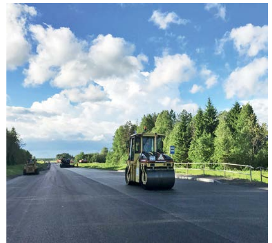
— Новые технологии позволяют производить ремонт своевременно и эффективно