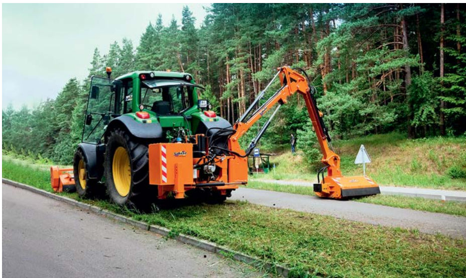
— Ежегодно предприятие производит покос на 600 км трассы

АВТОР Дарья Челкаш